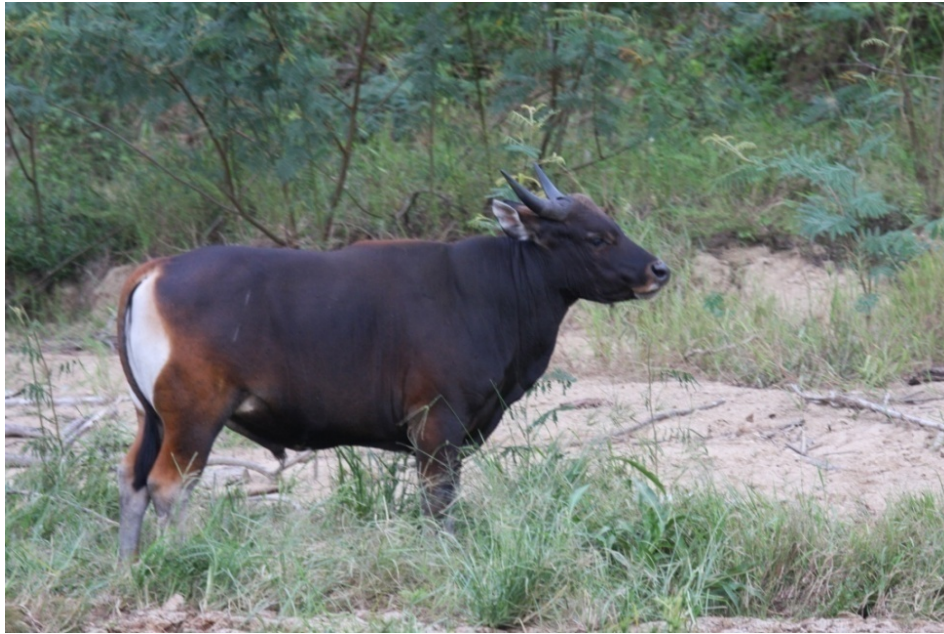
Gambar 2. Seekor banteng jantan sub species Bos javanicus lowi

Akibat dari kerusakan dan fragmentasi hutan yang berlangsung lama dan telah mencapai tahap lanjut, populasi banteng saat ini menempati fragmen-fragmen habitat yang sudah terisolasi antara satu dengan yang lainnya. Fragmentasi habitat telah memecah populasi besar menjadi populasi-populasi kecil yang memiliki resiko kepunahan makin besar.