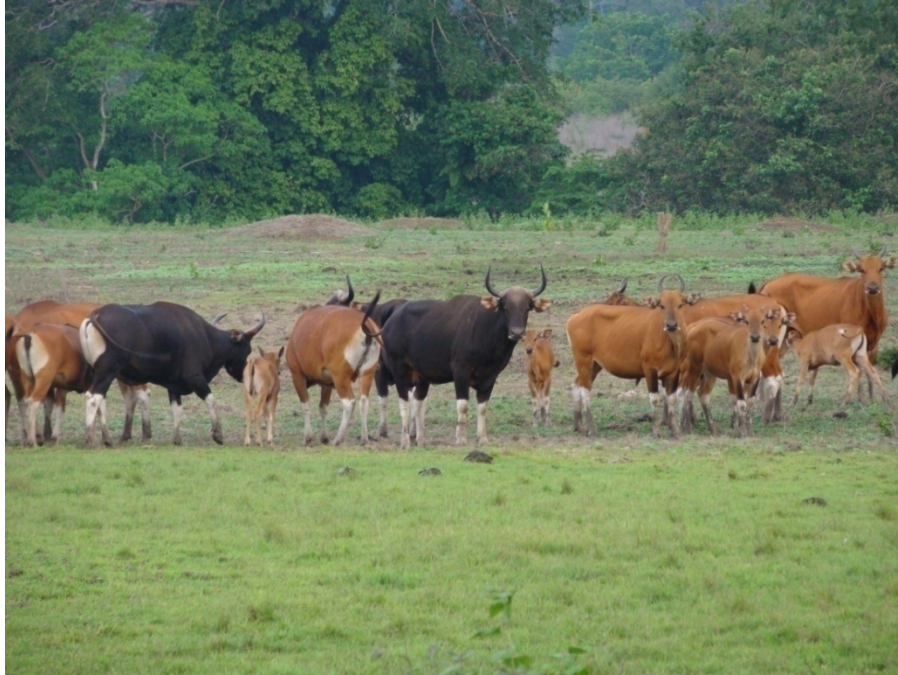
Gambar 1. Satu grup banteng terdiri dari jantan dan betina dewasa, betina remaja dan anakan di Taman Nasional Alas Purwo.

Status konservasi banteng berdasarkan IUCN Red List telah mengalami perubahan dari rentan/ vulnerable pada tahun 1986 - 1994 (Baillie & Groombridge 1996; Groombridge, 1994) menjadi terancam/ endangered berdasar hasil review pada tahun 1996 (Baillie & Groombridge, 1996). Hal tersebut menunjukkan meningkatnya ancaman yang mengakibatkan penurunan populasi. Workshop konservasi sapi liar pada tahun 1994 ( Asian Wild Cattle Conservation Assessment and Management Plan ) merekomendasikan banteng Asia ( Bos javanicus burmanicus ) diklasifikasikan menjadi critically endangered (Heinen & Srikosamatara, 1996). Perkiraan jumlah individu banteng di seluruh dunia saat ini berkisar antara 5.000-8.000 ekor (Hegdes & Tyson, 2002; The IUCN SSC , 2000). Populasi banteng yang besar saat ini, sekitar 6.000 ekor, justru berada di luar sebaran alaminya yaitu di Taman Nasional Garig Gurnag, Australia (Bradshaw et al. , 2006), meskipun masih diperdebatkan apakah jenis ini lebih merupakan sapi bali daripada banteng.